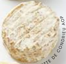
RIGOTTE DE CONDRIEU AOP